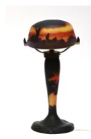
Lot 3 MULLER FRÈRES à Lunéville Lampe champignon