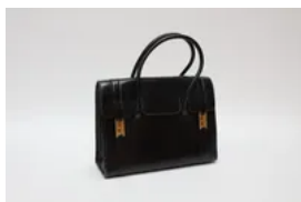
Lot 5 HERMÈS Paris Sac à main modèle Drag en cuir noir et Est. : 400 € - 600 €