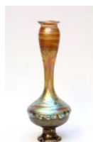
Lot 1 JOHAN LOETZ VEUVE (Manufacture) &