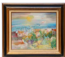
Lot 2 Emilio GRAU SALA (Barcelone 1911-1975)