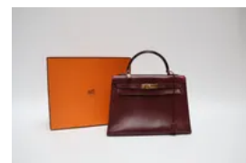
Lot 4 HERMÈS Paris Sac à main modèle « Kelly 32 » retourné